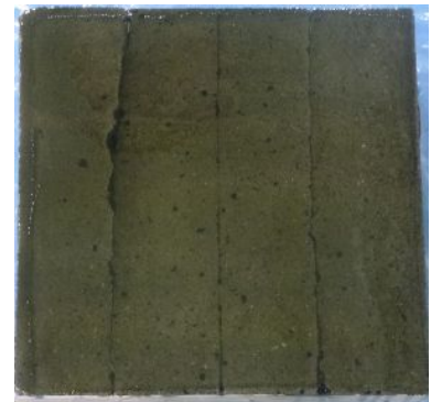
施工後 5 日